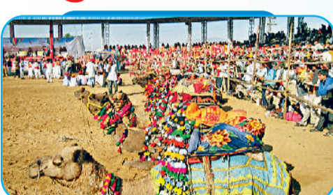
आयोजित होता है बहुत बड़ा पशु मेला

बड़ा मेला है। यहां समूचे भारत के ग्रामीण जीवन की जीवंत झंकाई देखने को मिलती है। राजस्थान के विभिन्न जिलों से लेकर इस मेले में हरियाणा, पंजाब, गुजरात और उत्तर प्रदेश तक के ग्रामीण लोग अपनी पारंपरिक वेशभूषा, गीत, नृत्य और हस्तशिल्प के साथ आते हैं। पुष्कर मेले में होने वाले लोकनृत्य प्रतिभागिताओं में मटकरी दौड़, ऊंट सजावट, ग्रामीण खेल, लोकसंगीत, कठपुतली, नाटक और पारंपरिक वाद्ययंत्रों की धुनें, भारत की विविधता में एकता का अद्भुत संदेश देती हैं। यह मेला वास्तव में ग्रामीण भारत की सजीव आत्मा पेश करता है। यहां महिलाएं पारंपरिक लहंगे, ओढ़नी आदि में सजी दिखती हैं और पुरुष रंग-बिरंगी पगड़ियों में सजते हैं। इसी वेशभूषा में ये लोग आयोजित होने वाले लोक गीत-संगीत के कार्यक्रमों में भाग लेते हैं। यहां की रंग-बिरंगी भीड़ वास्तव में भारत की जीवंत संस्कृति की धड़कन है, जिसने आधुनिकता के बीच भी अपनी जड़ें मजबूती से जमा रखी हैं।