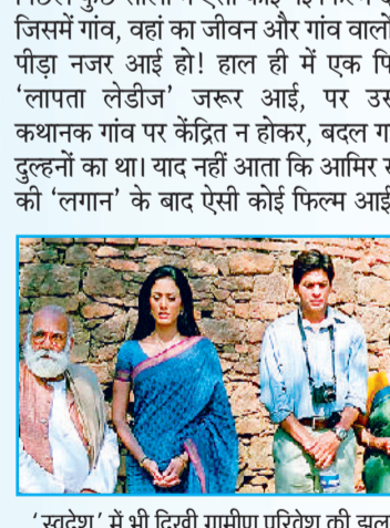
'स्वदेश' में भी दिखी ग्रामीण परिवेश की झलक

हा ल के वर्षों में आई हिंदी फिल्मों की बात करें तो उसमें गांव और ग्रामीण परिवेश की कहानियां बिल्कुल गायब रही हैं या न के बराबर ही नजर आई हैं। कथानकों से गांव विलुप्त होने का मतलब है, देश की 60% आबादी सिनेमा से गायब हो गई। अब जो फिल्में बनाई जा रही हैं, उनकी कहानियां 40% शहरी आबादी पर केंद्रित रहती हैं। इस सच्चाई को भी नकारा नहीं जा सकता कि गांव के जीवन की कहानियों से हिंदी सिनेमा का बॉक्स ऑफिस समृद्ध नहीं हो सकता। लेकिन समानांतर सिनेमा का तो मूल आधार ही ग्रामीण पृष्ठभूमि होती है, उसे ही इन कहानियों का प्रतिबिंब कहा जाता है। 'अंकुर', 'पार', 'दो बीघा जमीन', 'सूरज का सातवां घोड़ा' और 'अंतर्नाम' जैसी फिल्में ग्रामीण भारत का प्रतिनिधित्व करने में सफल रहीं। लेकिन अब ऐसी फिल्में भी नहीं बनती हैं। गांवों से दूर हो रही फिल्में: याद कीजिए कि पिछले कुछ सालों में ऐसी कोई नई फिल्म देखी, जिसमें गांव, वहां का जीवन और गांव वालों की पीड़ा नजर आई हो! हाल ही में एक फिल्म 'लापता लीडोज' जरूर आई, पर उसका कथानक गांव पर केंद्रित न होकर, बदल गई दो दुल्हनियों का था। याद नहीं आता कि आम्बि खान की 'लगान' के बाद ऐसी कोई फिल्म आई हो,