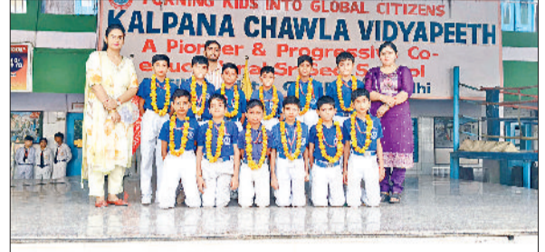
खरखोदा। खिलाड़ियों का स्वागत करते प्राचार्य व प्राथमिक प्रभारी।