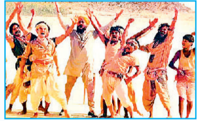
ग्रामीण परिवेश पर बनी हिट फिल्म 'लगान'

फिल्म आई, पर इसमें भी गांव मूल रूप में नहीं दिखा। कुछ साल पहले 'पीपली लाइव' आई थी, जो गांव की सच्चाई और समस्याओं वाली फिल्म थी। इसमें किसानों के लिए बनी योजनाओं को बाबुओं और अफसरों द्वारा हड़पने का जिक्र ज्यादा था। लेकिन बड़े तबके को यह फिल्म समझ में ही नहीं आई सो आर्थिक रूप से फायदेमंद नहीं रही।