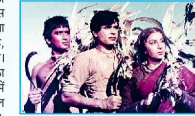
'मदर इंडिया' में दिखा वास्तविक ग्राम्य जीवन