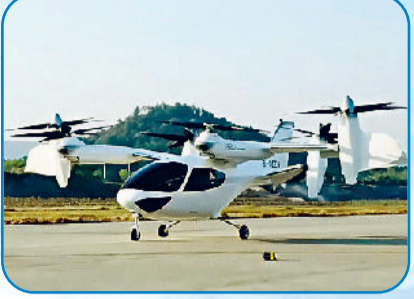
टीकेब कंपनी चीन की ई20 एयरटेक्स

क्रिस्से पूरी तरह से छा गए और हर किसी को पता लग गया कि उड़ने वाली कारों अब विज्ञान कथा भर नहीं हैं, वास्तविक जिंदगी का हिस्सा बनने की कगार पर हैं। निकट भविष्य में इनका उपयोग शहरी परिवहन, आपातकालीन सेवाओं और पर्यटन जैसे क्षेत्रों में बहुत कामान हो जाएगा।