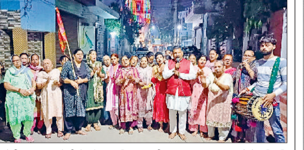
सोनीपत। प्रभातफेरी के दौरान महिला मंडली एवं अन्य।