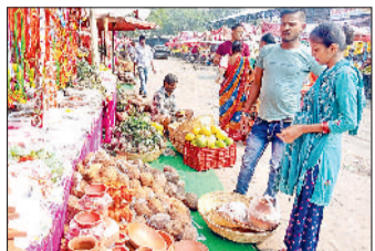
हरिभूमि न्यूज ॥ सोनीपत

सूर्य उपासना और छठी मैया की आराधना का चार दिवसीय महापर्व छठ शनिवार से श्रद्धा और भक्ति के साथ शुरू हो गया। सुबह से ही यमुना नदी के तटों और शहर के विभिन्न घाटों पर श्रद्धालुओं की भीड़ उमड़ पड़ी। व्रती महिलाओं ने पवित्र स्नान कर व्रत की शुरुआत की और परिवार की सुख-समृद्धि की कामना की। नगर निगम ने घाटों पर सफाई और सुरक्षा के विशेष इंतजाम किए हैं ताकि श्रद्धालुओं को किसी प्रकार की असुविधा न हो।