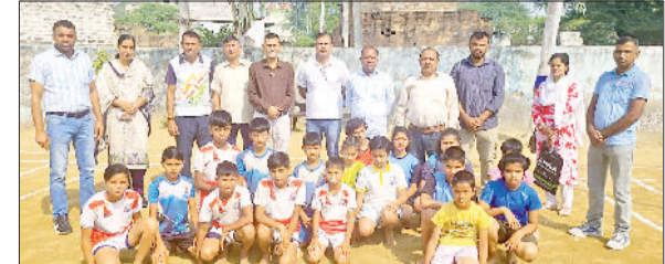
गोहाना। विजेता खिलाड़ी प्रसन्नचित मुद्रा में शिक्षकों के साथ।