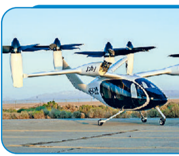
जॉबी एविएशन, अमेरिका की ईवीटीओल

चुका है। कई कंपनियां एयर टैक्सि शुरू करने की बिल्कुल व्यावहारिक योजनाएं बना चुकी हैं, तो कुछ देशों ने सर्टिफिकेशन की प्रक्रिया भी शुरू कर दी है। कहने का मतलब उड़ान कारें