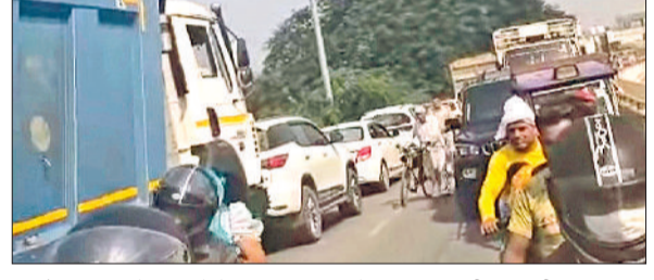
गन्जौर। खबडू रोड पर दोनों तरफ लगा वाहनों का जाम, लगी हुई लंबी लाइन।