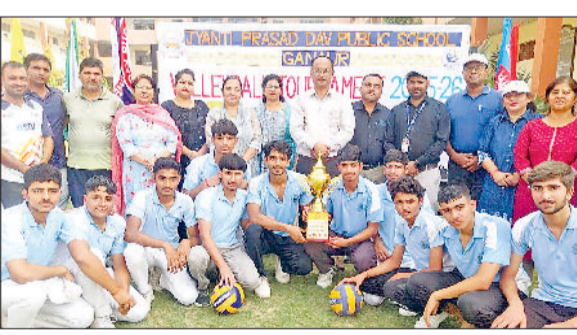
हरिभूमि न्यूज ॥ गन्नौर

जेपी डीवी पब्लिक स्कूल में खेल भावना को बढ़ावा देने के उद्देश्य से वॉलीबॉल प्रतियोगिता का आयोजन किया गया। प्रतियोगिता में विद्यालय के चारों सदरन अंबर, अगिन, पृथ्वी और वायु ने उत्साहपूर्वक भाग लिया। प्रतियोगिता का पहला मुकाबला अंबर सदन और अगिन सदन के बीच खेला गया, जिसमें दोनों टीमों के खिलाड़ियों ने शानदार प्रदर्शन किया। रोमांचक मुकाबले में अंबर सदन ने बेहतर रणनीति और तालमेल के बल पर जीत दर्ज की। इसके बाद दूसरा मुकाबला पृथ्वी सदन और वायु सदन के बीच हुआ, जिसमें पृथ्वी सदन ने शानदार