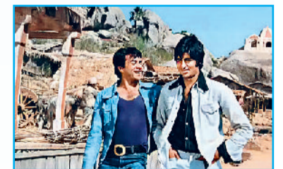
रामगढ़ गांव की पृष्ठभूमि पर बनी 'शोले'

ग्रामीण फिल्मों का था सुनहरा दौर: सिनेमा का एक दौर ऐसा भी आया था, जब गांव और गांव वाले ही सिनेमा की पहचान हुआ करते थे। लेकिन जैसे-जैसे सिनेमा का बाजार बढ़ा, परदे से गांव गायब होते गए। फिल्मों का इतिहास टटोला जाए, तो शुरुआती फिल्मों का कथानक गांव की पगडंडियों से होकर ही गुजरता। वी. शांताराम की 'दो बीघा जमीन', विमल रॉय की 'बादगा' और 'बंदिनी', राज कपूर की 'आवारा', 'श्री 420' और 'बूट पॉलिश' ग्रामीण परिवेश की ऐसी फिल्में थीं, जिन्होंने देश और दुनिया को वहां की समस्याओं और उनके जीवन से रूबरू करवाया था। गांव के जीवन पर बनीं इन फिल्मों में एक अलग सी महक होती थी।