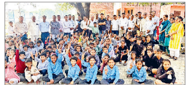
गोहाना। विजेता खिलाड़ियों को आशीर्वाद देते शिक्षक।