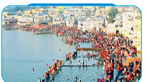
पुष्कर झील में स्नान करते श्रद्धालु

मेले से जुड़ी धार्मिक मान्यताएं: पुष्कर भारत का अद्वितीय नगर है। सृष्टि के रचयिता भगवान ब्रह्मा का देश में एकमात्र मंदिर यहीं स्थित है। पुष्कर की धार्मिक मान्यता यह है कि ब्रह्माजी सृष्टि की रचना करने के बाद यज्ञ करने के लिए एक पवित्रस्थल की खोज कर रहे थे, तब एक कमल पुष्प उनकी हथेली से गिर पड़ा और यह जहां गिरा, उस स्थान पर पुष्कर झील बन गई। इसलिए यह स्थल पुष्कर तीर्थ कहलाता है।