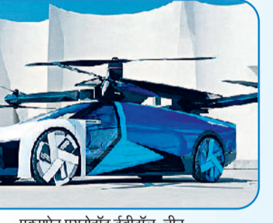
एक्सपेंस एयरोहॉट ईवीटीओल, चीन

सिर्फ सुरक्षा का ही नहीं, वास्तव में इन वाहनों की उड़ान और लैंडिंग की अनुमति भी एक बड़ी समस्या होगी, जिस पर इन दिनों